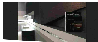
DESIGN OF DESIRE - 30/10/2016