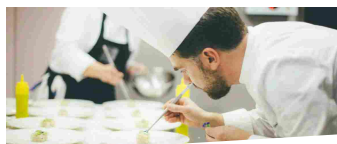
SOCIETY - 28/05/2018